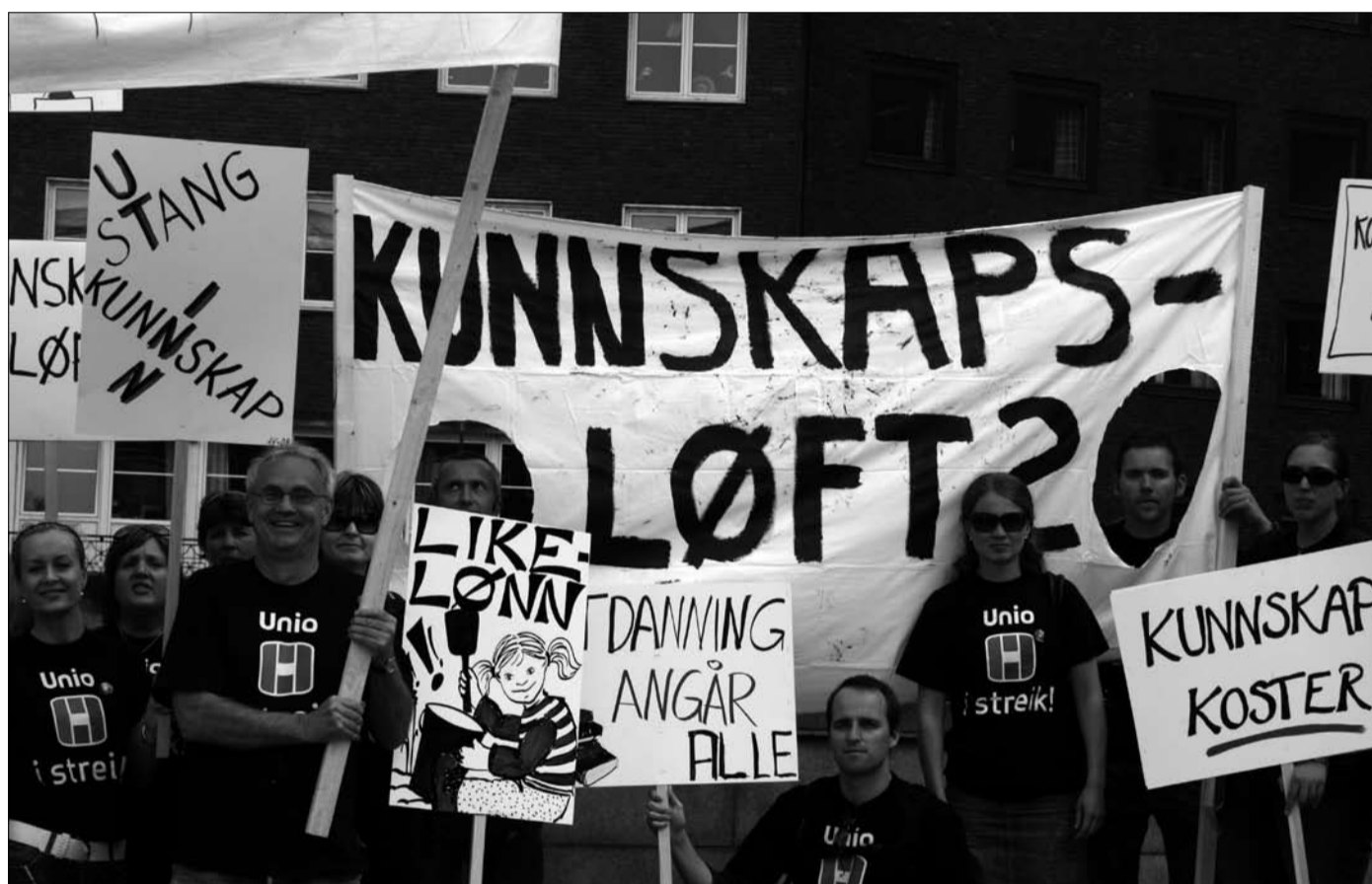
Kampvillige, streikende lærere utafor rådhuset i Oslo.

– Et løfte. Vi fikk et løfte om at hvis det blir en mindrelønnsutvikling for lærerne i Oslo fra 2007 til 2008, så skal det være grunnlag for forhandlinger i 2009. De siste årenes utvikling før 2007 skal ikke telle med. Vi har fått et vagt